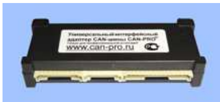
Рис.1 – Внешний вид Модуля

ВНИМАНИЕ! Отображение Модулем той или иной информации обусловлено наличием таковой в CAN-шине самого транспортного средства.